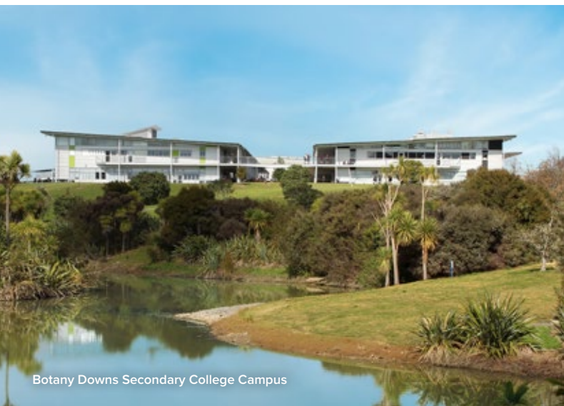
Botany Downs Secondary College Campus