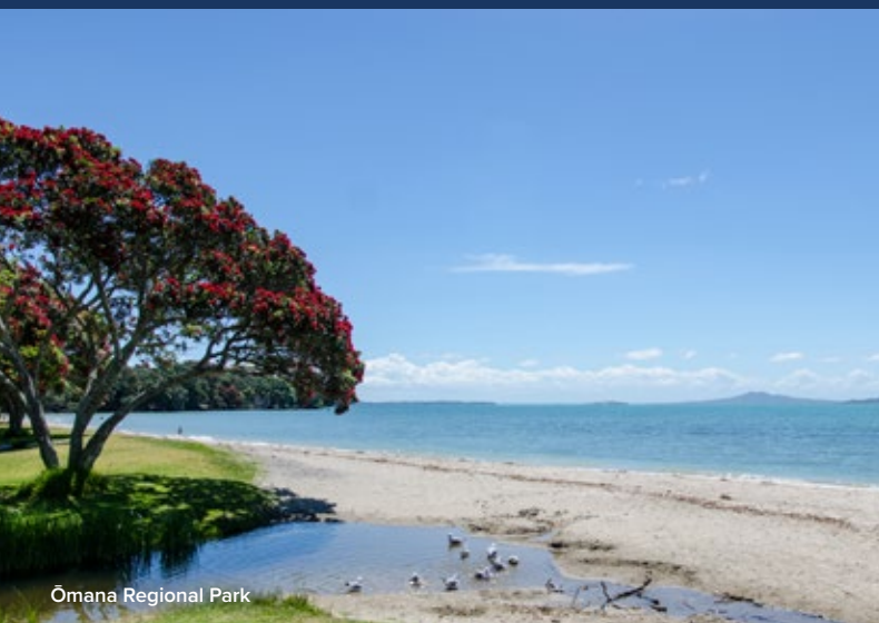
Ōmana Regional Park